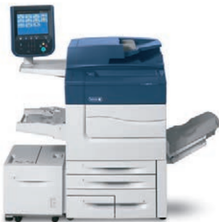
Drukarka Xerox® C60/C70 wraz z podajnikiem dużej pojemności.