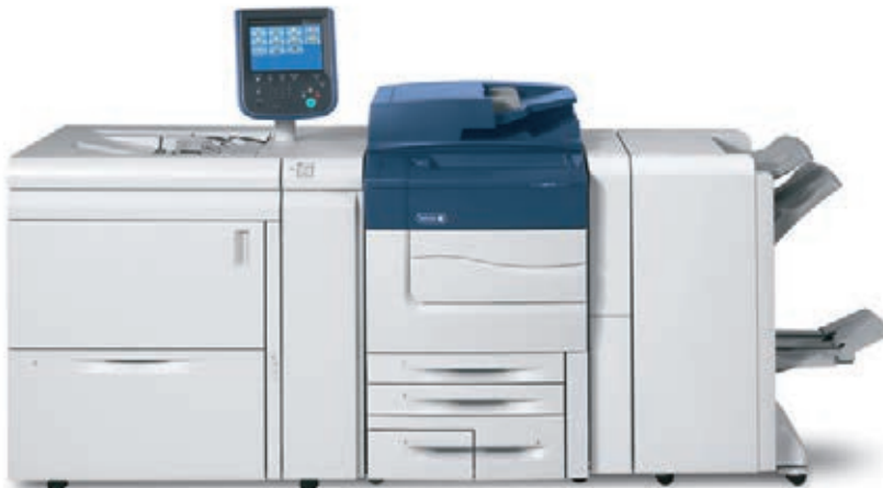
Drukarka Xerox® C60/C70 wraz z jednocacowym powiększonym podajnikiem dużej pojemności oraz finisherem BR z broszuownicą.