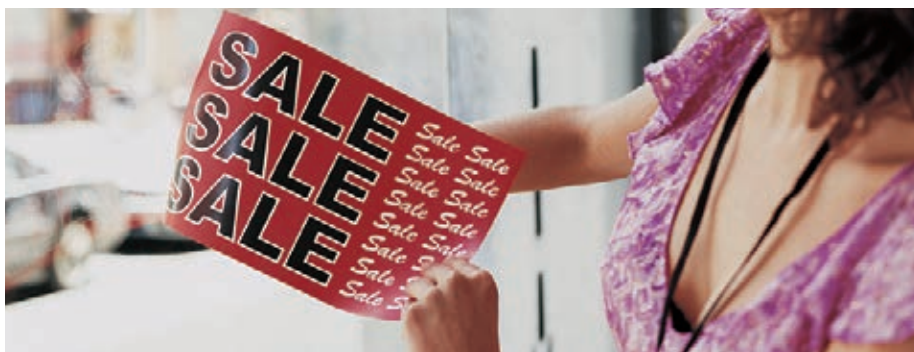
Ekspozycja okienna wydruku Xerox® NeverTear

Nasz specjalny poliestrowy toner EA o niskiej temperaturze topnienia wiąże się z nośnikiem poliestrowym za pomocą zastrzeżonej reakcji chemicznej. W efekcie powstaje wspaniałej jakości obraz na podłożach specjalnych, takich jak między innymi poliester. Toner EA z technologią Premium NeverTear jest odporny na wodę, olej, smar i przedzieranie.