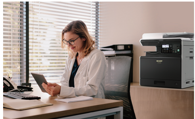
Stylowe dopełnienie każdej przestrzeni biurowej.

Zapomnij o skomplikowanej instalacji i nieestetycznych kablach. Opcjonalny moduł łączności bezprzewodowej LAN pozwala połączyć się z dowolnym urządzeniem obsługującym WiFi, by każdy mógł drukować i skanować bezpośrednio ze swojego smartfona, tabletu lub komputera za pomocą usług AirPrint, Google Cloud Print lub aplikacji Sharpdesk Mobile. Możesz także podłączyć nośnik USB i po prostu wybrać plik z wyskakującego menu, aby wydrukować bezpośrednio przechowywane dokumenty czy zapisać skany bez potrzeby korzystania z komputera.